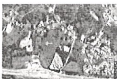
IMAGEM.png 1 MB

DEURB. JANEIR O TRECHO CITADO NA POSSUI DENOMINAÇÃO OFICIAL ATÉ O MOMENTO.